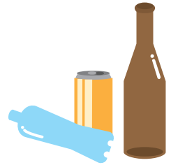
屋外に放置された空きビン・缶・ペットボトル