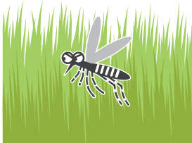
風通しの悪いやぶ・草むら

公園、学校、寺社、空海港、駅などの施設を管理されている方もご協力をお願いします!