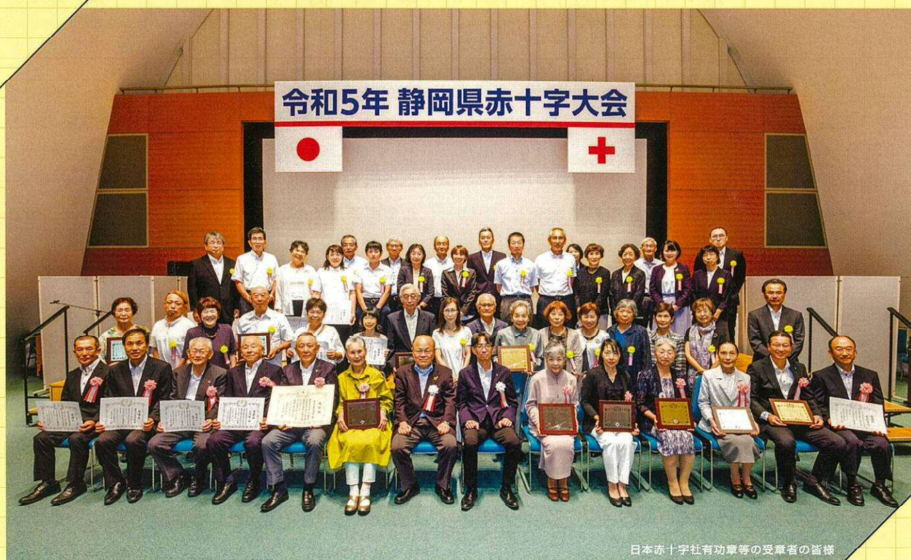
日本赤十字社有功章等の受章者の皆様

私たちは、その思いを365日 「人間のいのちと健康、尊厳を守る活動」に つなげていきます。