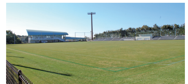
▲磐田スポーツ交流の里 ゆめりあ球技場