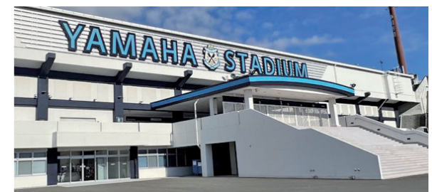
▲ヤマハスタジアム