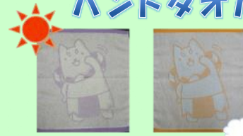
ハンドタオル(むらさき) ハンドタオル(オレンジ)

申込書に必要事項を記入して、スタンプのたまったカードをつけて実施会場の交流センターへお申込ください。