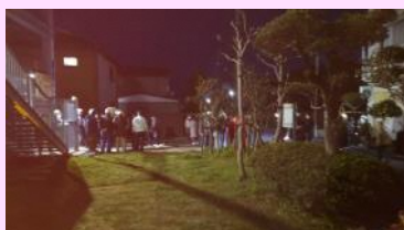
掛塚避難タワーの様子

3月9日（土）、津波・地震避難訓練が昨年と同様、夜間訓練として実施されました。午後6時30分、強風が吹き、凍てつくような寒さの中、行政無線によるサイレンとともに住民の皆さんが懐中電灯などを携え、避難行動を開始しました。今年の正月に能登半島地震が発生してから間がないため、これまでの訓練より早く避難タワーや避難ビルに避難することができました。南海トラフの大規模地震発生では19分以内の避難が目標とされますが、「地震だ、津波だ、すぐ避難！～少しでも早く、少しでも高く～」を胆に銘じておくようにしましょう。