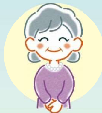
Pessoa Viúva - Kafu

Conforme artigo 6 da Lei do Bem-estar das Viúvas, Mães e filhos (as), Pais e filhos(as), define-se a pessoa do sexo masculino que não possui cônjuge (viúvo por motivo de óbito, separação de corpos por divórcio, desaparecimento da cônjuge sem a confirmação de vida, etc.) e atualmente possui dependente familiar com idade de 20 anos incompletos.