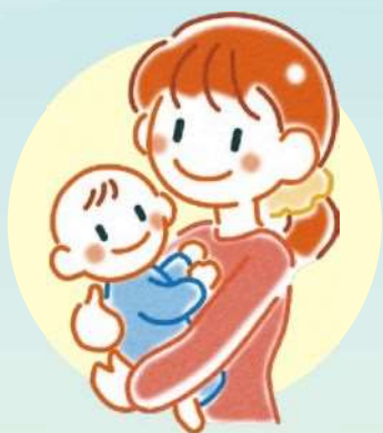
Mãe de Família Monoparental- Boshi Katei no Haha

Refere-se a família composta de Mãe e filhos(as), Pai e filhos(as), pessoa viúva, etc. (que não se casou após o falecimento do marido).