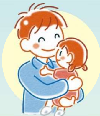
Pai de Família Monoparental- Fushi Katei no Chichi

Conforme artigo 6 da Lei do Bem-estar das Viúvas, Mães e filhos(as), Pais e filhos(as), define-se a pessoa do sexo feminino que não possui cônjuge (viúva por motivo de óbito, separação de corpos por divórcio, desaparecimento do cônjuge sem a confirmação de vida, etc., tornou-se Mãe sem o registro de casamento, etc.) e atualmente possui dependente familiar com idade de 20 anos incompletos.