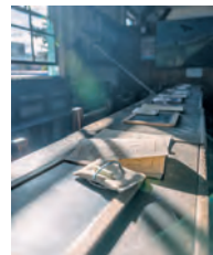
教室に差し込む日差しは いつの日も暖かい (細澤 達弥さん)