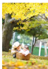
まもりたいもの (大杉 佑衣さん)