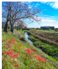
初秋の敷地川 (オレンジのプロツ子さん)