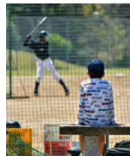
僕と野球の出会い (erikoさん)