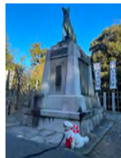
我が家のゆるキャラ (菊地 優輝さん)