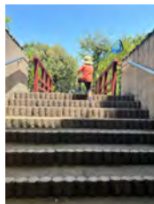
今日こそは 僕にまかせて! (中島 睦さん)