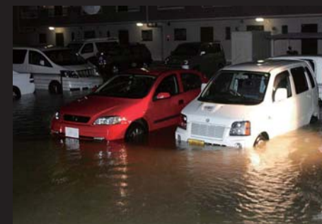
平成16年11月の集中豪雨による内水氾濫状況(旧磐田市二之宮)