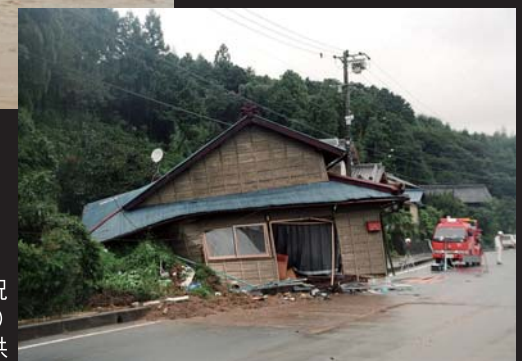
平成10年9月の土砂崩れ状況(旧豊岡村敷地)