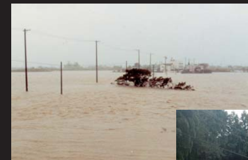
昭和58年台風5号による浸水状況(旧福田町豊浜)