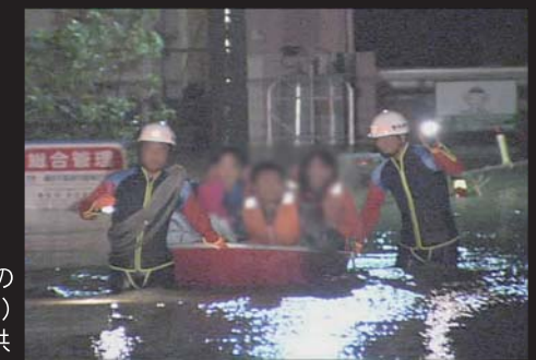
平成16年11月の集中豪雨時の避難状況(旧磐田市二之宮)