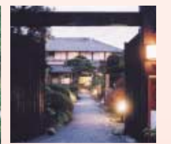
庭園に広がる約1,000株の花菖蒲 花咲乃庄(沓貴地429 ☎(0539)62-2316)

国 民宿舎遠州ふくで荘板長 ふくで荘では、福田港で水揚げされた新鮮な魚介類を提供しています。これからの時期は、生シラスやカツオがおすすです。また、冬は「天然のトナリ」、夏は「ハモ」と四季を通じて新鮮な魚介類をお楽しみいただけます。新市の観光拠点として、市内外からたくさんの方が訪れてくれることを期待しています。遠州灘の美味を、ぜひ味わってください。