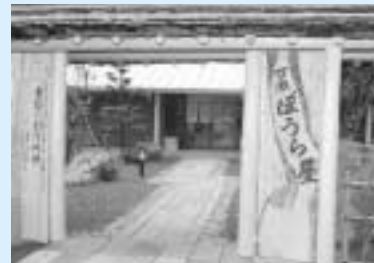
▲万瀬ぼうら屋では、コース料理のほか、ケーキセットなども楽しめる

磐田市の最北端に位置する万瀬 まんせ 。年々と過疎化が進み、深刻な問題になる中、万瀬の暮らしと自然を愛する