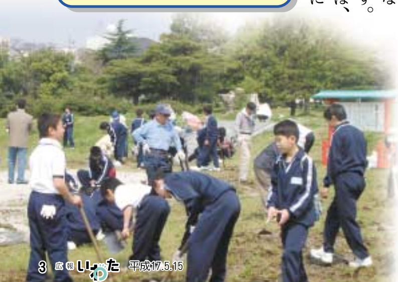
中学生や高校生も参加した遠江国分寺の除草作業 (遠江国分寺を考える会の恒例行事・4月16日)

今年も、6月5日に全市を挙げての美化活動を行います。より美しいまちを目指して、環境美化にみんなで取り組んでいきましょう。