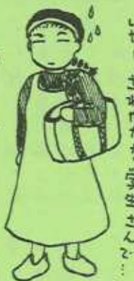
「カー」さお母かなる学生さん?!

「ちっちゃい幸せも=でっかい幸せも」 最近の私には、日々の生活に流され、大切に 最今とる事を忘れていた気がして、大事な 先日の朝、友人達と山梨県にあって来王様。 ひまわりをのぞいて、その日の最後、トネルの 晴れ下、この景色と迎えてくれたのだと 感じ、美味しい物を食べたり、買い物をして 美味い温泉に入ったり、一日満喫した た事で、その事に気がまじった。嬉しかったり、 今私には、ささいな事が嬉しかったり、 楽しい大きなHAPPYになり、誰にでも、 沢山の事を体験し、乗り越えて生きて いると思えます。みなさん、ちっちゃい幸 せが沢山集まって、でっかい幸 せになればいいなと思っています。