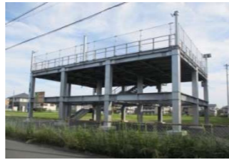
津波避難タワー（福田地区）