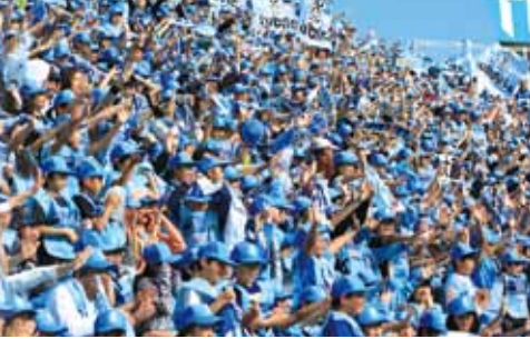
ヤマハスタジアム