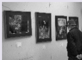
※昨年度の展示の様子です。

毎年恒例人気の写真展です。 福田在住のアマチュア写真家による可憐で繊細でたくましい自然の花たちと風景を楽しめます。 会場：福田中央交流センター 展示室