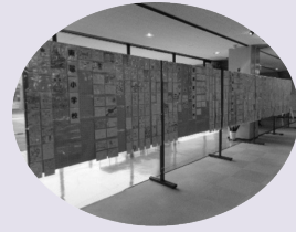
※昨年度の展示の様子です。

磐田税務署管内の小学6年生の皆さんによる、税への思いを込めた絵はがき全作品を展示します。 主催：磐田法人会ほか 後援：国税庁、磐田市ほか