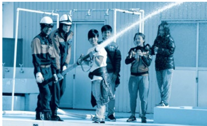
↑ Treinamento do ano passado