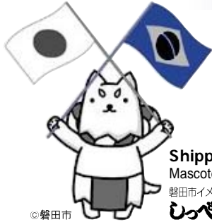
Shippei Mascote da cidade 磐田市イメージキャラクター しっぺい