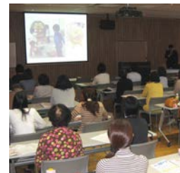
▲11月6日の研修会の様子

また、磐田市では生活リズムの大切さをさらに地域に広めていくため、子育て支援センター・幼稚園・保育園の職員などに対してスキルアップ研修会を行いました。