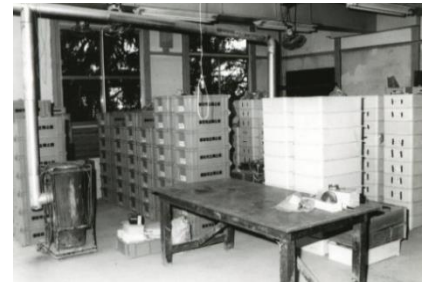
中央町収蔵庫内部

旧見付学校も、昭和52年頃の解体修理以前には、遺物が保管され整理作業もおこなわれていました。