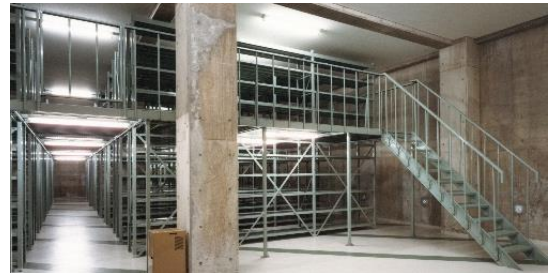
完成当時の収蔵庫