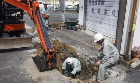
工事立会いの様子（見付端城遺跡）

磐田市には、300 を超える埋蔵文化財（遺跡）が存在しています。しかし、埋蔵文化財は、地下に埋もれているため、知らずに工事をおこなうと埋蔵文化財が破壊されたり、失われたりしてしまう恐れがあります。遺跡の範囲内で掘削を伴う工事をおこなう場合は、その規模に関係なく、計画の段階で文化財課にご相談ください。