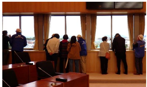
国分寺まつり「展望ツアー」でのガイド