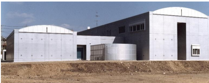
完成当時の埋蔵文化財センター

埋蔵文化財センターが完成し、文化財行政の拠点がセンターにうつり、こうした施設からも遺物を移動しました。開所当時、コンテナは約3,000箱でした。現在、その数は約8,000箱になり、棚だけでは収まらず、棚の周囲にもコンテナを積み上げています。