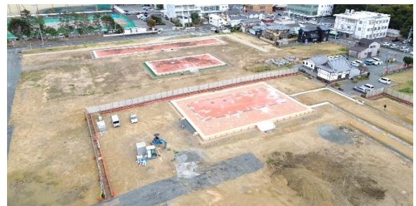
整備の進む遠江国分寺跡（令和 8 年 3 月ドローンにて撮影）

文化財課のドローンは、機体本体とカメラのレンズが一体化しており、撮影する際に手元のコントローラーで画角を確認しながら撮影できるという利点があります。しかし、ドローン（カメラ）は空中にあるため、鳥や風、電線など様々なことに注意しなければならないという難しさもあります。