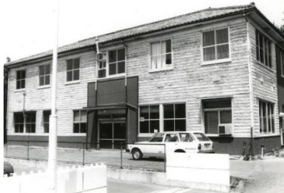
中央町収蔵庫外観

右の写真は、見付にあった旧農業事務所を収蔵施設として利用していた時の写真です。広さは120坪あり、内部には遺物を収納したコンテナが積まれて並んでいました。