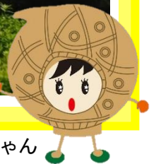
文化財課イメージキャラクターともちゃん