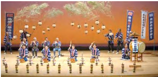
イベント出演時の様子