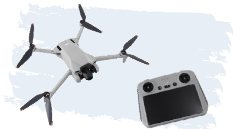
ドローンとコントローラー

あれから 10 年あまり、フィルムを取り巻く状況もかわり、現在は市内の発掘現場ではデジタルカメラのみを使用しています。さらに、近年では空中撮影も、ドローンを使って一部文化財課でおこなっています。