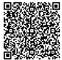
市 HP 該当ページ

問合せ先 文化財課 TEL:0538-32-9699/FAX:0538-32-9764