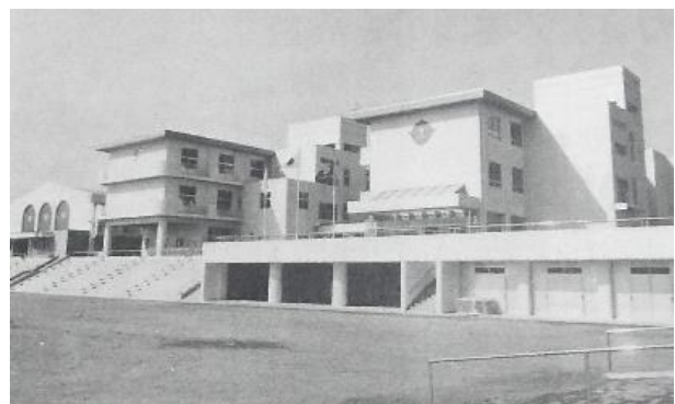
開校当時(昭和58年)の豊田東小学校