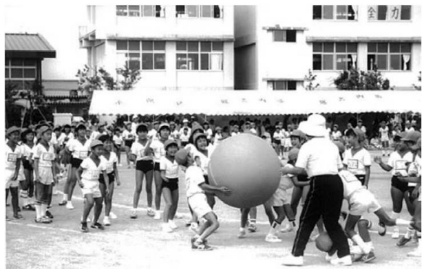
昭和63年に竜洋北小で開催した運動会の様子

また、教室で実際に使われていた机と椅子も展示しています。椅子に座ることも出来ますので、ぜひ展示会場で体験してみてください。