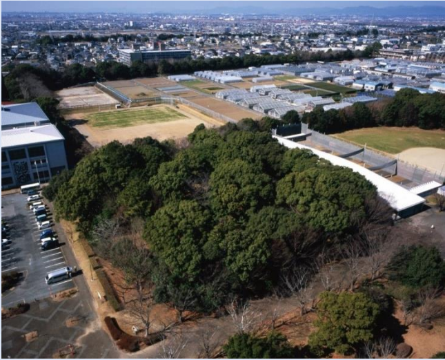
兜塚古墳空中写真（南東側上空から撮影）