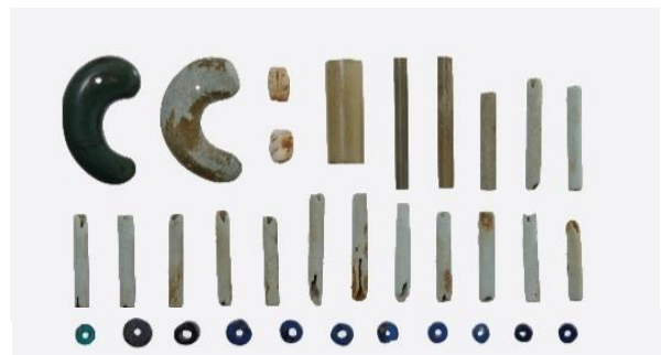
勾玉・管玉・ガラス玉（勾玉の長さ 3.5 cm）