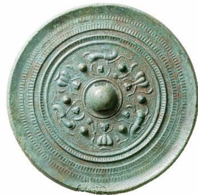
三神三獣鏡（径 20.1 cm）

また、勾玉には碧玉 へきぎよく 製のものが含まれ、身分の高さをうかがわせます。また、昭和54年の第1次発掘調査を皮切りに、5度の発掘調査がおこなわれ、古墳の外側の墳丘を取り巻く周溝が見つっています。周溝からは円筒埴輪片が出土しています。