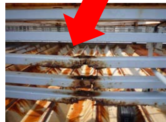
↑目隠しルーバーのサビ・腐食。