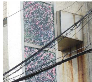
←ブラケット下に汚ダレが見られると、内部の取付金具にサビや腐食の可能性もある。