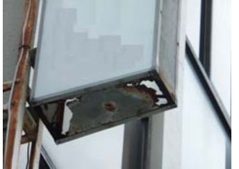
↑看板底部の留め具が壊れるとアクリル板が抜け落ちる原因にも。