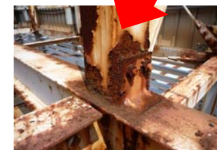
↑内部鉄骨のサビ・腐食。