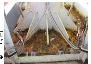
看板の根元がカバーで覆われている場合、表面はきれいでも内部でサビが進行している恐れも。