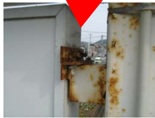
←取付金具のサビや腐食。ボルトやビス等が欠落していたら緊急の対応が必要。放置すると看板が落下する恐れも。