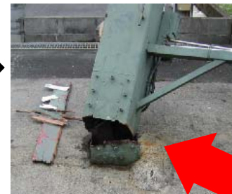
折れた柱の根元。点検口のボルト穴からサビが入り腐食して、鉄骨が破断した。

交通の激しい沿道で看板の柱が折れたが、隣地の看板が支えとなり、道路への倒壊を免れた事故。電線を切断すると停電による損害賠償額は膨大な金額になることも。