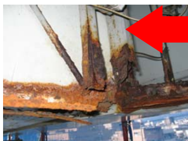
↑板面裏側のサビ、腐食。サビによる腐食はミルフィーユ状に剥がれ崩落する恐れも。