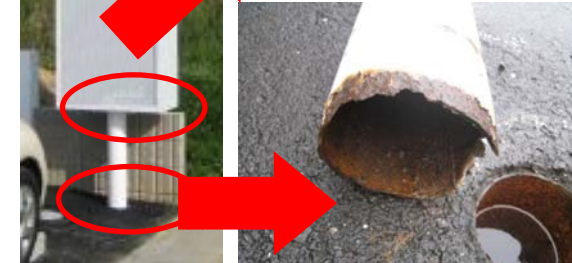
↑柱根元のサビを放置し、倒壊。

倒壊・落下の危険を見つけたら! ◆付近を立入禁止にし、見張りを置く。 ◆信頼できる屋外広告業者に連絡。 ◆人通りの多い場所では警察にも連絡。