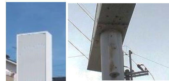
↑看板本体からポールへの汚ダレがあると、接合部にサビや腐食が進行する恐れ。