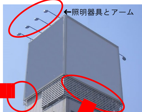
←照明器具とアーム

外照式の屋上看板では照明器具のアーム接合部の腐食やボルトのゆるみがあると器具が落下する恐れがあります。