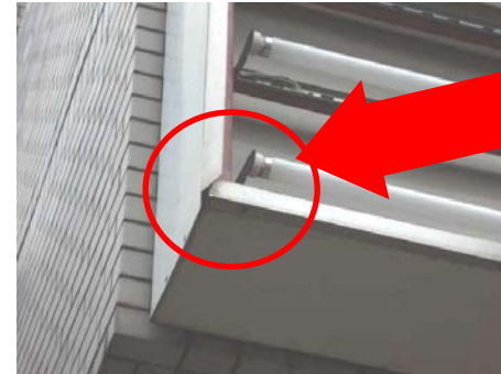
←パネルの変形、ズレ、破損の他、パネルの押さえ枠が変形し落下する場合も。

表示パネルの四方を押さえ枠で固定する欄間看板。複数枚のパネルを使用する場合は、隣り合うパネル同士をきちんと固定しないと、振動や風などで落下する恐れがあります。