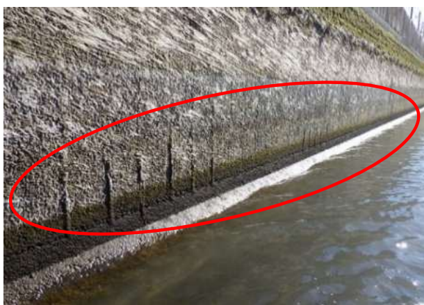
用水路の老朽化（鉄筋露出）