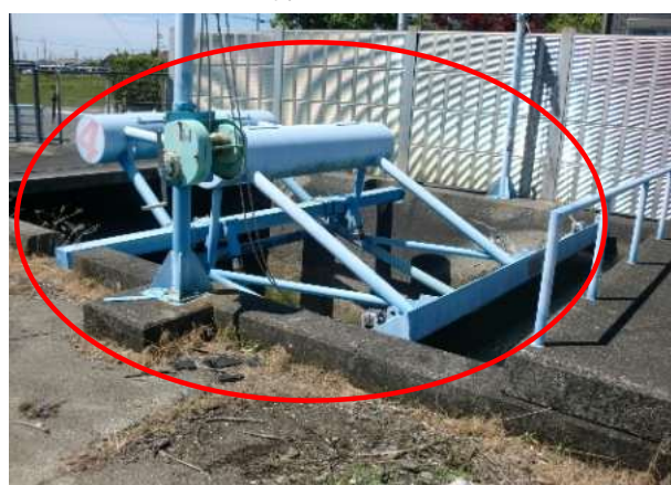
水位を上げる施設の老朽化