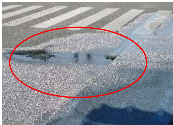
地下に埋設されているパイプラインの漏水・路面一部陥没