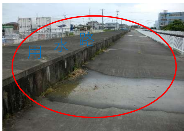
用水路からの漏水