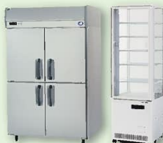
業務用冷凍冷蔵庫