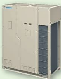
ビル用マルチエアコン