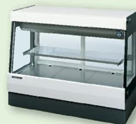
冷凍冷蔵用ショーケース など