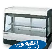
冷凍冷蔵用 ショーケース