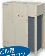
ビル用 マルチエアコン