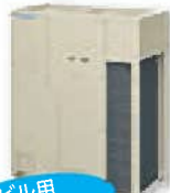
ビル用 マルチエアコン