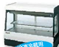
冷凍冷蔵用 ショーケース