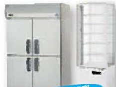
業務用冷凍冷蔵庫