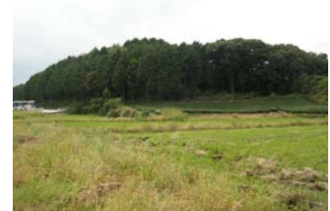
磐田原台地斜面樹林地