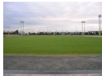
竜洋スポーツ公園