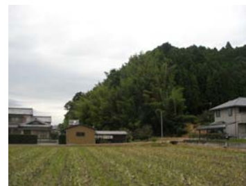
磐田原斜面樹林地と集落