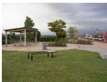
福田中川グリーンロードの ポケットパーク