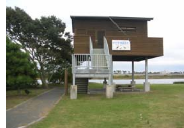
太田川河口の野鳥観察舎