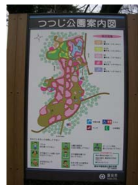
つつじ公園案内図