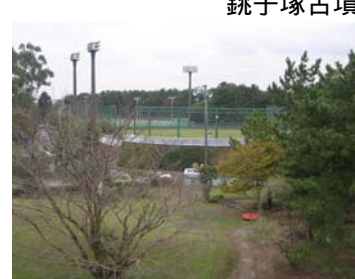
豊岡総合センター