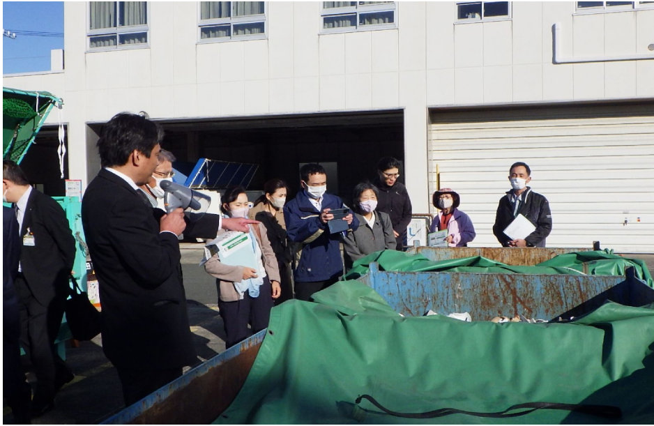
<リサイクルステーションでの説明の様子>