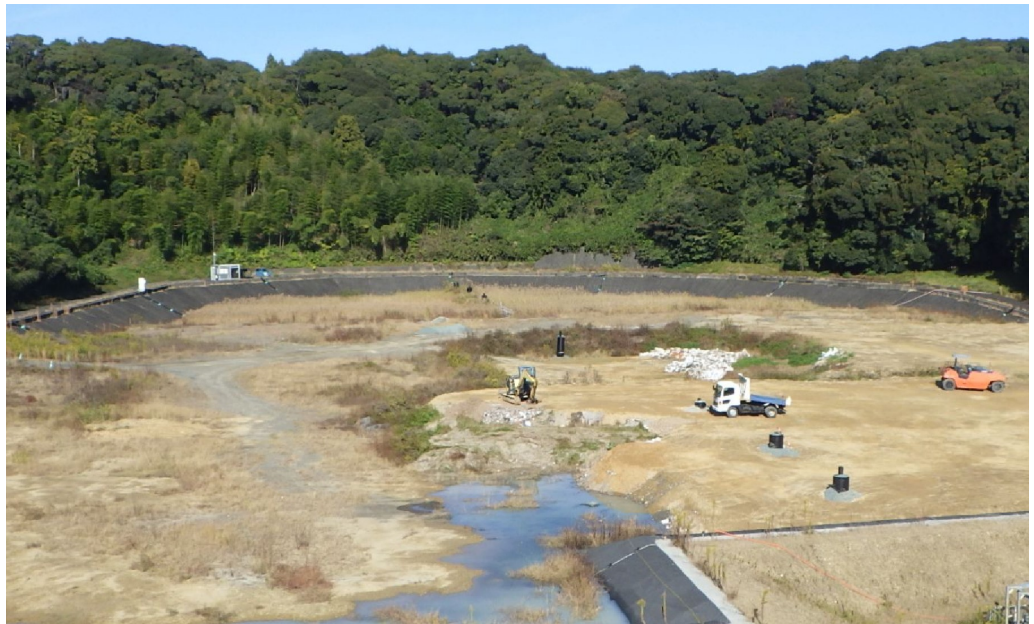
<最終処分場の全体の様子>