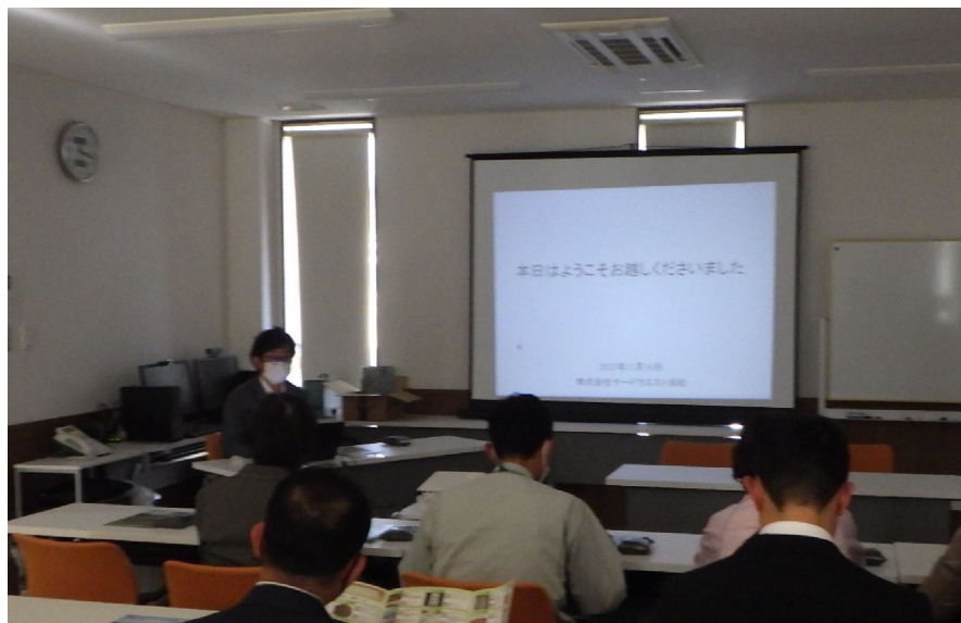
<イワタ草木リサイクルセンター 説明の様子>