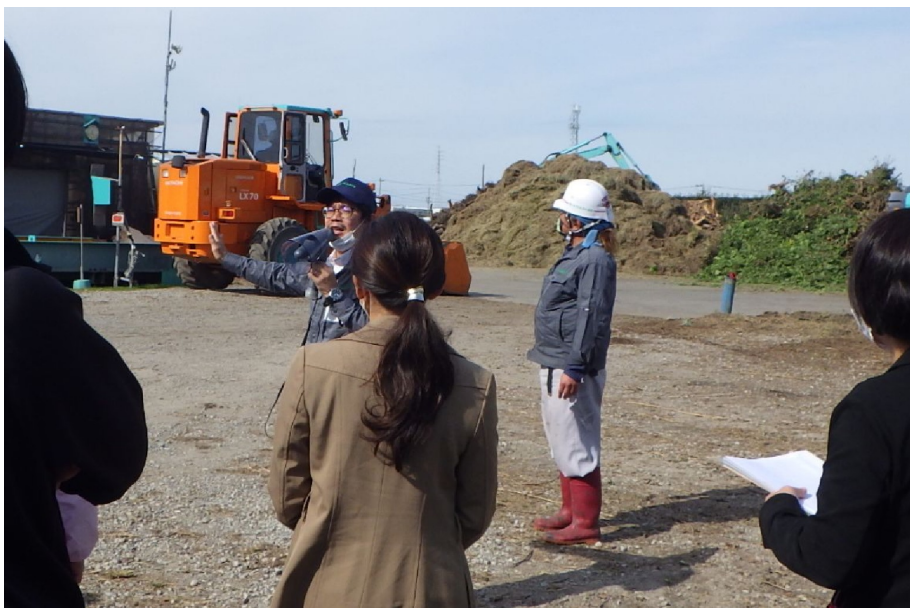
<イワタ草木リサイクルセンター 搬入現場の様子>