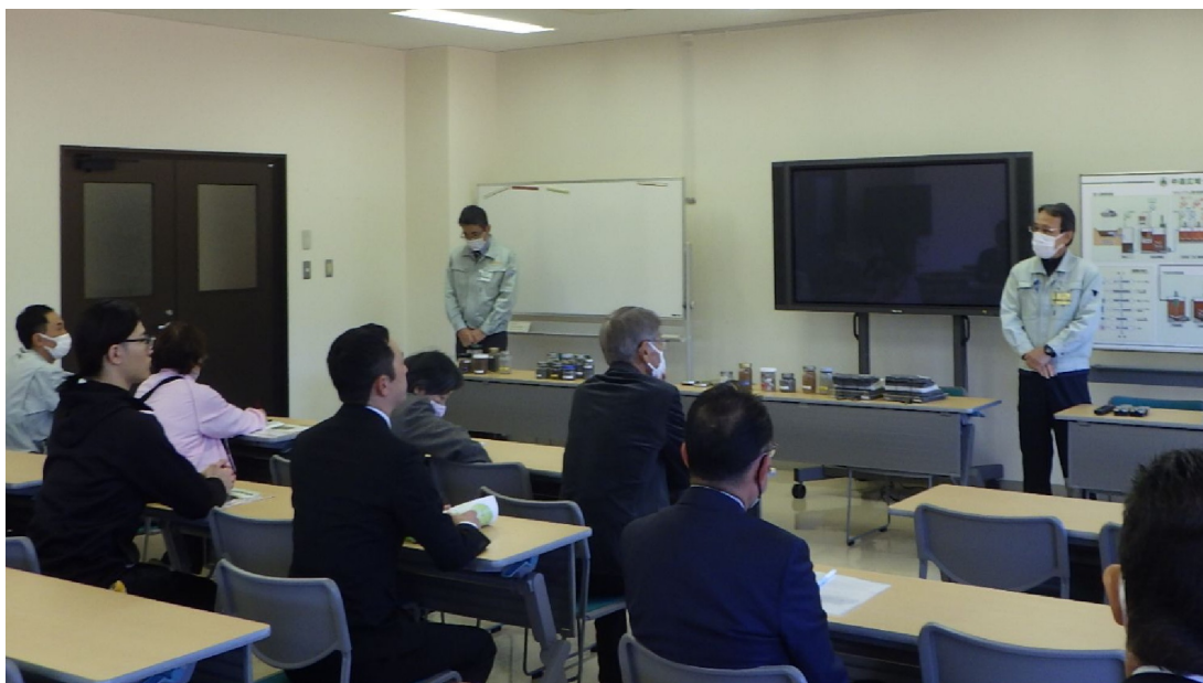
<最終処分場での説明の様子>