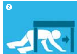
Proteja sua cabeça!