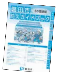
Guia de Prevenção de Desastres da Cidade de Iwata

Vamos procurar agir com rapidez (buscando refúgio por iniciativa própria), sem ficar aguardando os anúncios de evacuação como o "Aviso de evacuação [Hinan kankoku]", etc. Por exemplo, caso comece uma inundação, vamos evitar, o máximo possível, nos colocar em situações de perigo. O mais importante é garantir nossa segurança, pensar "numa mínima ação, que seja para salvar nossas vidas".