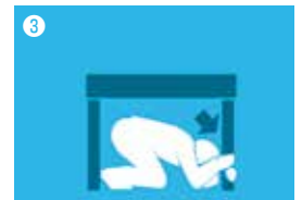
Não se mova!