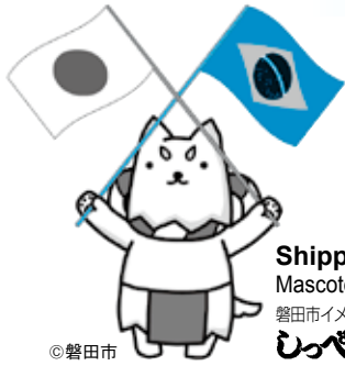
Shippei Mascote da cidade 磐田市イメージキャラクター うっぺ