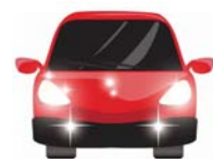
ライトオン目安時刻

交通事故はお互いの存在をいち早く知ることで防ぐことができます。反射材を着用すると約60m先から、また、自発光式反射材は100mも手前から歩行者・自転車の存在を運転者に知らせることができます。十分な距離で存在を知らせ、大切な命を守りましょう。