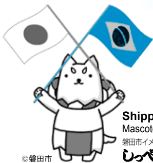
Shippei Mascote da cidade 磐田市イメージキャラクター しっぺい