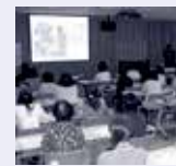
Foto de um estudo de aperfeiçoamento realizado em novembro, em Iwata, voltado para os funcionários dos “Centros de apoio à criação de filhos” [Kosodate Shien Center], creches e jardins de infância, para difundir cada vez mais na região, a importância da rotina diária.

Para que tais situações não ocorram, vamos rever a rotina das crianças. Melhorando um item que seja, já se iniciará um ciclo benéfico. Vamos tentar, na medida do possível, introduzir os seguintes hábitos no dia a dia.