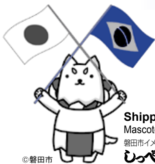
Shippei Mascote da cidade 磐田市イメージキャラクター しっぺい