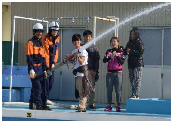
↑ 昨年の防災訓練の様子

大地震などの大規模災害が発生した時、行政や消防、警察などの力だけでは十分な対応ができません。被害を最小限に留めるため、「自分の身は自分で守る（自助）」、「自分たちの地域は、自分たちで守る（共助）」という心構えが、災害に強い地域を作ります。9月1日（日）は自治会連合会で定めた総合防災訓練統一実施日です。（地域の事情により訓練実施日は異なる場合があります）各自治会（自主防災会）で実施される「防災訓練」に参加しましょう。