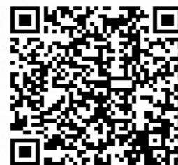
▲厚生労働省ホームページ