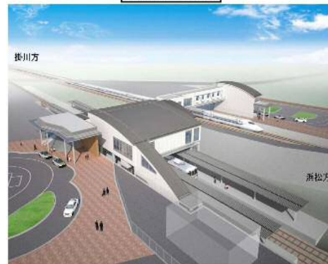
新駅イメージパース

問い合わせ先：都市整備課（西庁舎1階） Tel：0538-37-4830 Fax：0538-37-8690 地域づくり応援課（本庁舎2階） Tel：0538-37-4811 Fax：0538-32-2353