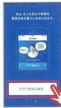
④「アプリをはじめる」を タップ