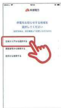
①「広域エリアから 選択する」をタップ

停電情報の配信を希望する地域を選択してください。 「広域エリア」「郵便番号」「住所」の3種類からご登録ができます。 (下記は広域エリア選択のイメージ)