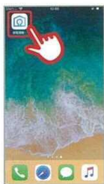
①「アイコン」をタップ

「停電情報お知らせサービス」アプリをダウンロード後、 ホーム画面のアイコンをタップして起動します。