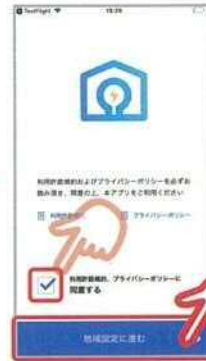
⑤「同意する」をタップし、 「地域設定に進む」をタップ