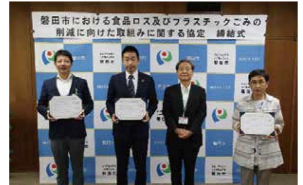
▲協定締結式の様子(R5.9.1)