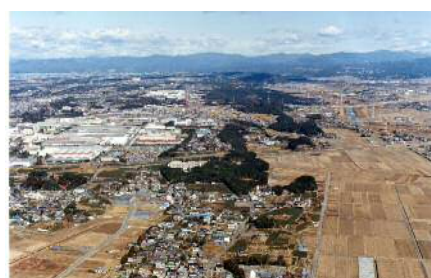
南から見る磐田原台地東縁の風景 (古墳がたくさん築かれています)

台地には 1000 箇所以上の遺跡があります。これらの遺跡から、磐田には約 2 万年前の旧石器時代から人々が住み始め、縄文・弥生時代にも台地上にムラを作り、見晴らしのよい縁辺部には多くの古墳を築きました。奈良時代には国府や国分寺が置かれ、それ以降江戸時代に至るまで遠江国の中心地として人々が活動したことがわかります。