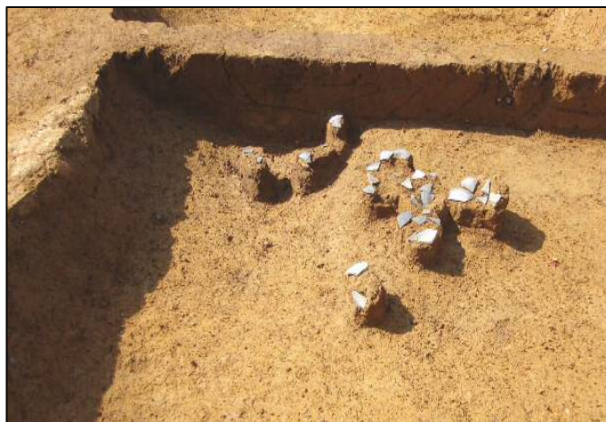
周溝から見つかった土器

この後、古墳を造る風習は衰退していくようになります。「死」に対する観念が、それまでと大きく変わっていったものと思われる。