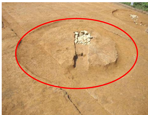
古墳のかたち(南東から) 赤く囲った部分が周溝

今回の調査では、600 m 2 の調査区内で、茶畑の耕作土の下から7基の古墳が見つかりました。いずれも墳丘 ふんきゅう は失われていましたが、埋葬施設(遺体をおさめるところ)の基礎や、墳丘をとり囲んでいた溝(周溝 しゅうこう )は残っていました。周溝を含めた古墳の大きさはどれも10m未満と小型で、円形をしています。調査区の南側では、別々の古墳の周溝が重なるところがあるほど、狭い範囲にたくさんの古墳が築かれていました。