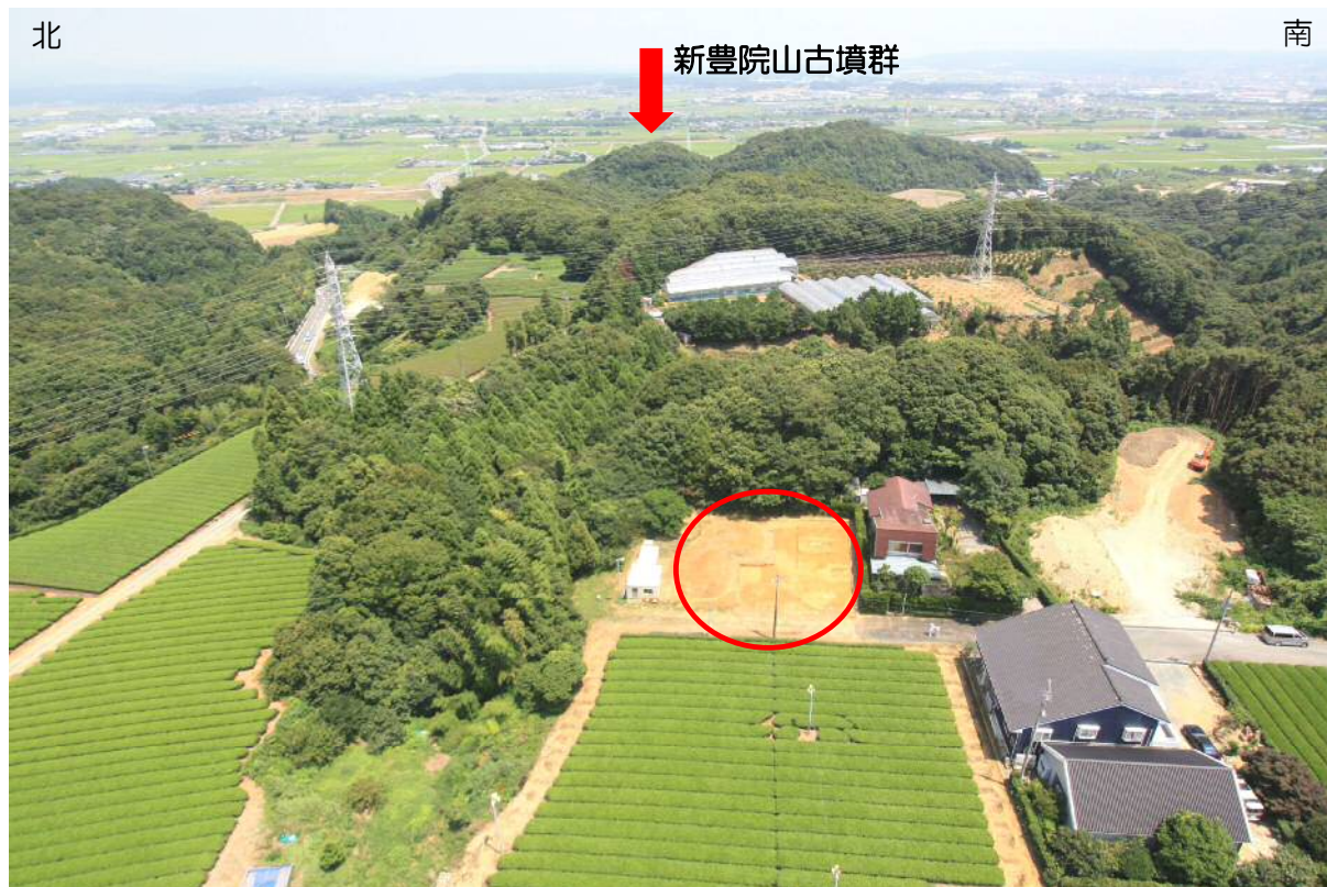
磐田原台地東縁(西方向から)

中原A古墳群は磐田原台地の東縁(向笠竹之内地内)に位置し、約700m東側には国指定史跡・新豊院山古墳群 しんぼういんやま があります。新豊院山古墳群と時期は異なりますが、その付近には古墳時代の中頃から終わりにかけての集団墓地が築かれており、この古墳群もその中の1つです。