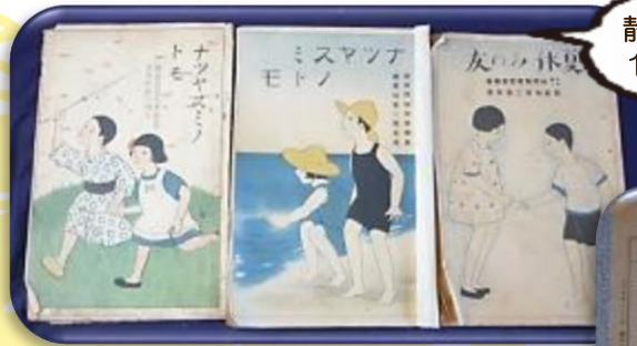
夏休みの友(左から 昭和7年・昭和6年・昭和4年のもの) <展示品(2階)>

日本の学校制度は、明治維新の頃に欧米の制度を基本に作られましたので、当初の学校の1年は9月から7月まででした。明治25年(1892)には4月始業が正式となり、4週間の夏休みが定められ、明治34年(1901)には8月いっぱい夏休みになりました。