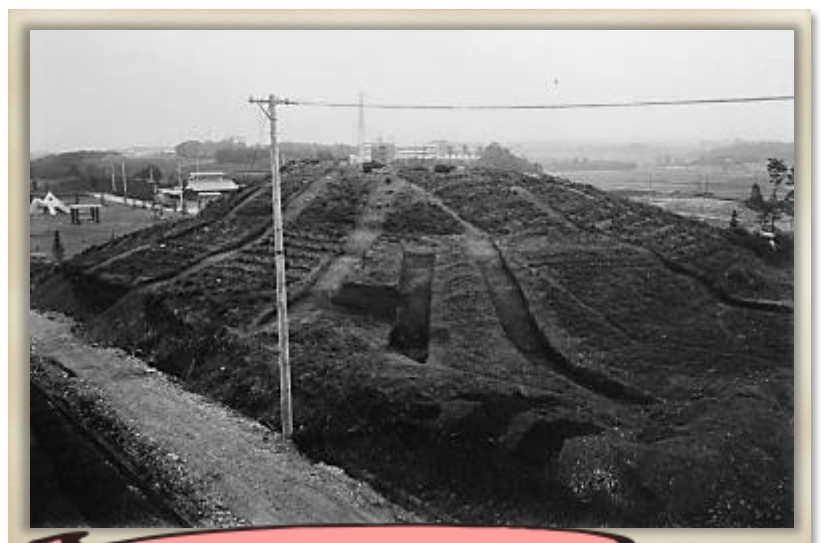
発掘調査中の城之崎丸山古墳（南から）

周溝 しゅうこう が墳丘 ほにわ の南側で、埴輪 はにわ が北側で見つかりましたが、遺体を埋葬した主体部 ふくそうひん や副葬品 ふくそうひん は発見されませんでした。古墳時代中期前半（5世紀前半頃）に造られたと考えられます。