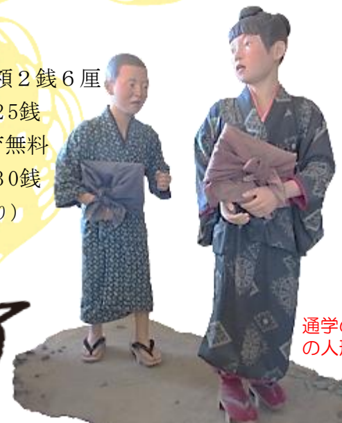
通学の様子の人形2体