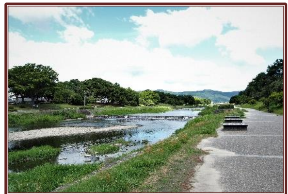
賀茂川（京都）の風景

3 月まで大学生として京都に住んでおり、今年から磐田に移ってきたのですが、磐田に来てみるとどこか懐かしい川の名が…。それは、「加茂川」です。通っていた大学の近くを流れる「賀茂川」を思い出します（字が少し違いますが…）。