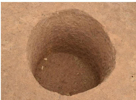
平成 28 年度広野遺跡調査で見つかった土坑

近年、 あしたか 県内東部の箱根・愛鷹山麓や西南日本各地で丘陵の尾根上に連続的に並んで見つかる例が増えたことから、動物を狩猟する際の落とし穴であったと考えられるようになり、広野北遺跡の土坑の役割も見直されてきています。今回見つかったものも落とし穴だったのでしょうか。今後、調査研究を進めていきます。