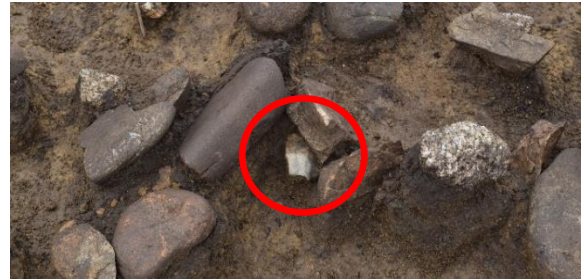
焼け礫の下から石器が出土した様子