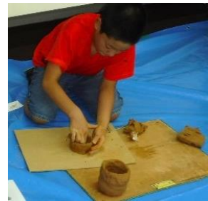
昨年度の土器作りの様子

問合せ 磐田市教育委員会文化財課(埋蔵文化財センター内) 磐田市見付3678-1 TEL:0538-32-9699 FAX:0538-32-9764