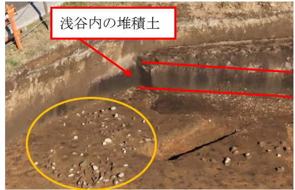
浅谷近くで見つかった礫群（○が礫群）

※珪藻は種類によって生息環境が異なり、珪藻が含まれているか否か、また含まれている珪藻の種類を特定することで当時の環境を推定することができます。