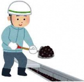
雨水桝や側溝の清掃