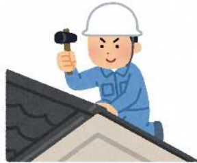
家の修理（屋根瓦のずれ、雨どいのつまり）