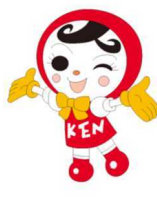
人権イメージキャラクター 人KEN あゆみちゃん