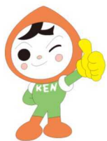
人権イメージキャラクター 人KEN まもる君