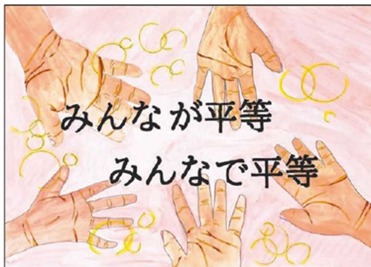
令和6年度小学生ポスターコンテスト (優秀賞)