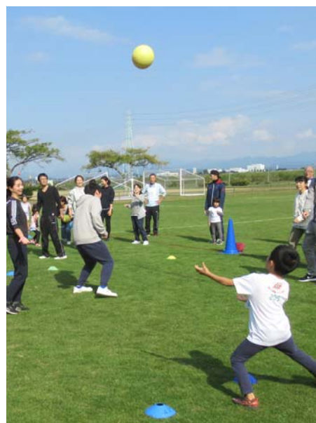
▲昨年度の親子ふれあい体育教室の様子