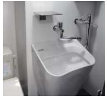
《オストメイト対応》