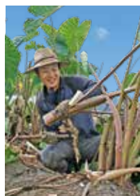
待ちに待った海老芋の初収穫に思わず笑顔