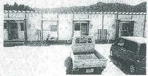
仮設住宅、1DK(4.5帖)で部屋が狭く苦情が多い。

復興にかかる問題点として、熊本県は住民の合意なく県道の4車線化を進めようとしています。この工事により300戸の住宅、商店、医院が移転を迫られます。住民は現状の2車線で歩道やバス停ゾーン、交差点の右車線新設で15m各幅での対応を県に求めています。さらに益城町の中心部の木山地区（地震で家屋の9割が倒壊）に土地区画整理事業が計画され、区画整理に伴う「換地」や「減歩」により倒壊を免れた家屋や新築した家屋も影響を受けると予想され大きな問題となっています。町は事業を進める能力に限度があるため、事業を県に委託しているとのことでした。