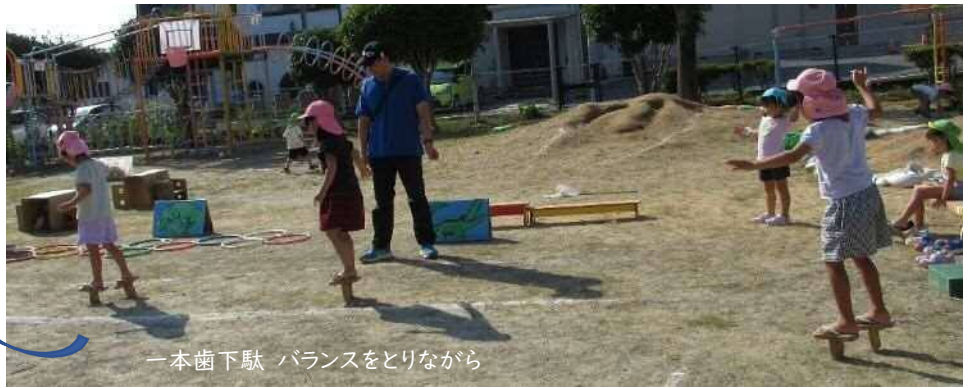
一本歯下駄 バランスをとりながら