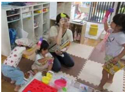
《園だより 9 月号より》

「子ども達は、ここを玄関に見立てているので、お家の中に入るために、傘(に見立てたブロック)を置いたのだと思います」