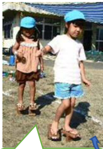
5歳児の様子を見て、4歳児や3歳児も挑戦