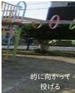
的に向かって投げる

「〇〇が全員達成」「〇〇をやらねばならない」ではなく、好きな遊びや生活を十分楽しむ中で下記にある『人の36の基本動作』を参考に、様々な体の動きを経験し、『 体を動かすの楽しいな 』という思いを味わってほしいと願っています。