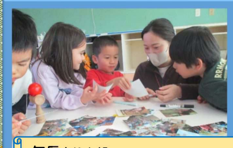
年長きりん組 思い出を振り返り読み札の文を自分で考える