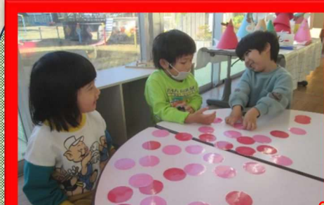
年少りす組 顔写真のみのカルタ 読み札なし