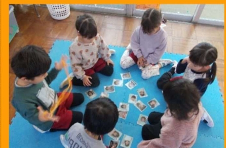
年中うさぎ組 顔カルタに文字環境 読み札あり