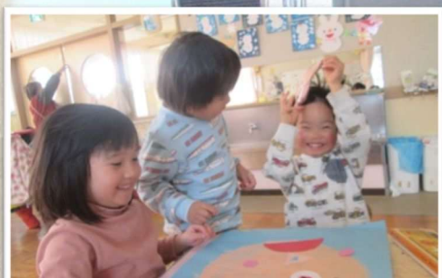
「ふくわらい」完成した顔にみんなが笑顔に… 試行錯誤しながら空間認知力も養われます♡

豊田南こども園では、正解をすぐに言うのではなく、問いを中心とした会話の中で子どもたちの考える力（思考力）を育てています。