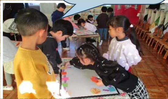
繰り返し修正がきくように画用紙の裏にマグネットシートをはり、ホワイトボード上のすごろくは、試したり工夫したりがいっぱい♡