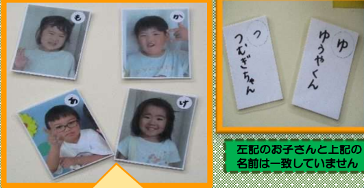
左記のお子さんと上記の名前は一致していません