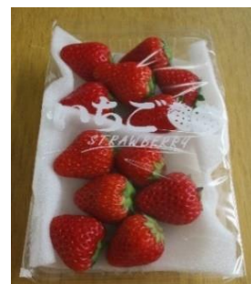
上段が「きらび香」 下段が「紅ほっぺ」