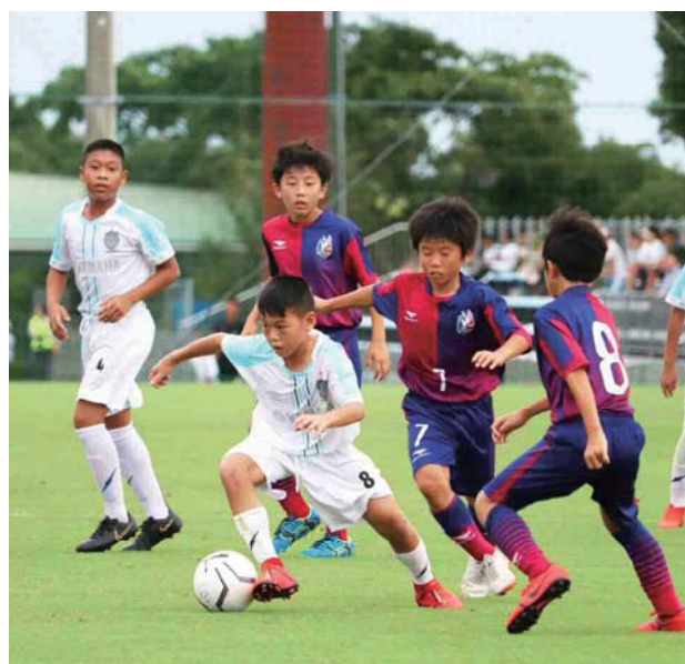
▲令和元年（2019年）度大会の様子