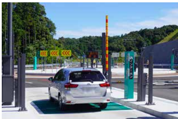
▲7月17日午後3時に最初の1台がゲートを通過しました