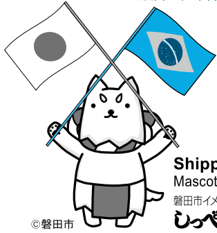
Shippei Mascote da cidade 磐田市イメージキャラクター しっぺい